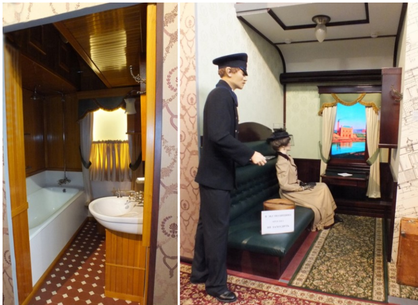
Внутри старинного вагона

начальника станции и фигуры рабочих-путейцев, занятых ремонтом. В начале Великой Отечественной войны московские рабочие в депо им. Ильича построили бронепоезд «Смерть немецко-фашистским оккупантам». Немало железнодорожников ушло на фронт. Сохранилось много подлинных предметов этих лет – оружие, одежда, документы. Интересна пожелтевшая ведомственная газета «Гудок», вышедшая 9 мая 1945 г. с радостной вестью о Победе над фашизмом.